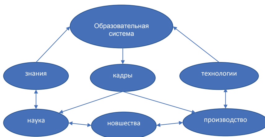
Рис. 4. Система взаимодействия и взаимообогащения науки, образования и производства

Таким образом, развитая система подготовки высококвалифицированных кадров выступает основой воспроизводства научно-технологического потенциала государства. Важность и актуальность такой подготовки обусловлена тем, что в настоящее время большинство промышленных предприятий (как крупных, так и малых) не обладают специалистами, которые могут грамотно продвигать наукоемкую продукцию на рынок. Общая потребность в таких кадрах, по свидетельствам российских исследователей [12], составляет несколько десятков тысяч человек. Проблему можно решить, только организовав целенаправленную работу по их подготовке.