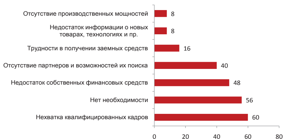
Рис. 3. Ответы респондентов на вопрос: «Если ваша компания не производит инновационные продукты, то по каким причинам?» (в % от тех, кто не производит инновационные продукты)