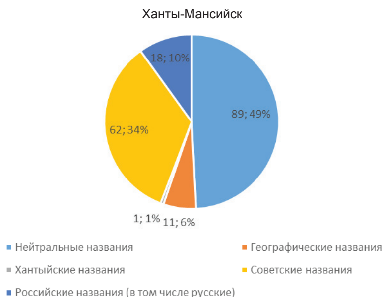
Рис. 2. Представленность разных идентичностей в названиях улиц Ханты-Мансийска

нию подвергались улицы во всех частях города. Исследование показало, что символическое пространство города в значительной степени складывалось под влиянием советского наследия. Наибольшее число улиц (31–32 %) по исследуемым районам названы в честь прославленных советских, российских деятелей или событий (улица 50-летия Октября, улица Академика Филатова, Пролетарская улица и т.д.). В значительной степени представлены и «нейтральные» названия, такие как Дачная, Березниковская, Биологическая улицы и другие (27–32%). Около четверти названий в изучаемых районах происходит от географических наименований (например, Краснодонская, Балтийская улицы, Черноморский переулок). Наименьшее влияние оказывают башкирские и татарские названия. Только 13–17 % улиц названы в честь географических названий и известных личностей двух народов (например, улица Сагита Агиша, улица Нарыштау, Чекмагушевская улица и др.).