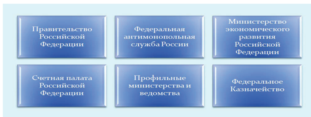
Рис. 1. Органы государственной власти, участвующие в управлении и контроле внедрения контрактной системы в сфере закупок на федеральном уровне

Органы государственной власти, участвующие в управлении и контроле внедрения контрактной системы в сфере закупок на федеральном уровне представлены на рис. 1.